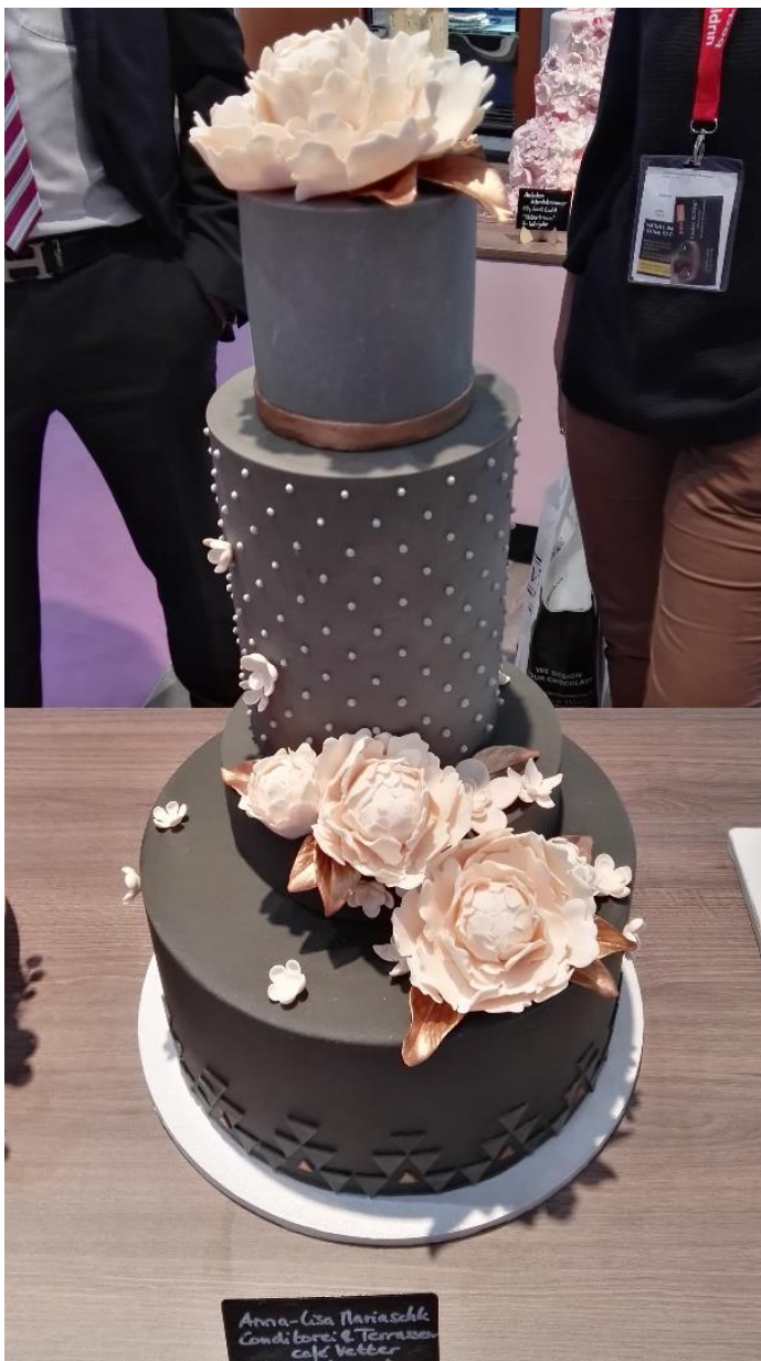
2. Platz mit der Hochzeitstorte „Blütentraum“ von Anna-Lisa Mariaschk.

Hierbei gab es die unterschiedlichsten Themen der Torten von „Maritim“ über „Klassisch“ bis hin zum ausgefallenen „Steampunk“.